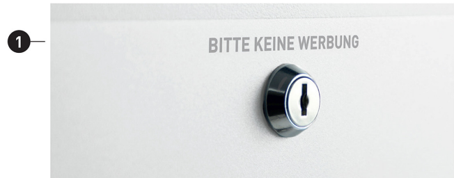
* schriftgröße: ca. 0,5 cm * font height: ca. 0.5 cm